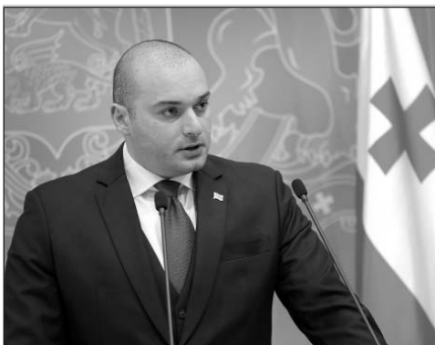
Կարելուր եւ պատասխանատու օր: Երկրում անց-

Հոկտեմբերի 25-ին Վրաստանի վարչապետ Մամուկա Բախտաձեն, կառավարության միստից առաջ հրավիրված մամուլի ասուլիսում, երկրի քաղաքացիներին կոչ արեց ակտիվորեն մասնակցել հոկտեմբերի 28-ին անցկացվելիք նախագահական ընտրություններին, քանի որ այդ օրը Վրաստանը նախագահական ընտրություններով կհամծնի եւս մեկ շատ կարելուր ժողովրդավարության թեստ: