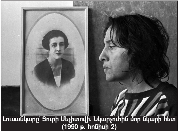
Նկարչուհին մոր նկարի հետ (1990 թ. հունիսի 2)

Մայիս ամիսն ինձ ականայից հիշեցրեց հանճարեղ նկարչուհի Գայանեին, քանի որ այդ ամիսը ճակատագրական էր նրա համար, ծնվել էր մայիսի 9-ին, իսկ կյանքից հեռացել՝ այդ ամսվա առաջին օրը: Կարծում եմ՝ ինչպես անցյալում, այնպես էլ՝ ներկայում ու ապագայում Գայանեին նվիրված խոսքերն ու մտքերը ժողովրդելի, ամփոփվում ու դեռ ի մի են բերվելու հետագայում, իսկ մենք փորձենք ներկայացնել մեր Գայանեին՝ որպես մեծագույն հարգանքի տուրք նրա պայծառ հիշատակի առաջ, այն համոզմամբ, որ ապագան Գայանեինն է: