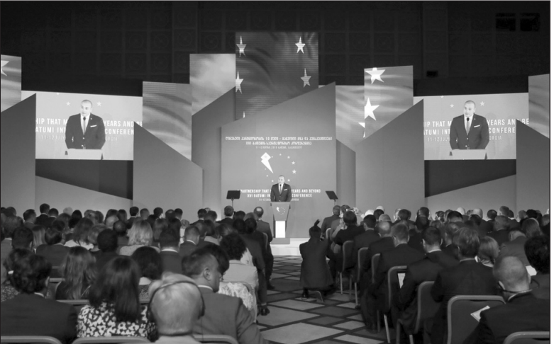
(Շարունակությունը՝ 3-րդ էջում)

Հունիսի 11-12-ը Բաթումիում անցկացվեց «Վրաստանի եվրոպական ուղին»՝ «Արժանի գործընկերության 10 տարի. անցած ուղի եւ հեռանկարներ» բարձր մակարդակի միազգային համաժողովը՝ նվիրված Արեւելյան գործընկերության 10-ամյակին: Համաժողովի աշխատանքին մասնակցում էին Եվրոպայի խորհրդի նախագահ Դոնալդ Տուսկը, հունանիտար օգնության եւ հակաճգնաժամային միջոցառումների հարցերով եվրակոմիսար Քրիստոս Ստիլիանիդիսը, Եստոնիայի վարչապետ Յուրի Ռատսիսը, Հայաստանի արտաքին գործերի նախարար Զոհ-