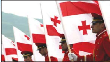
Մեր շենքի պատշգամբներից ծածանեցին Վրաստանի դրոշը:

Ավանդույթի համաձայն, այդ օրը Թբիլիսիի քաղաքային սակրեբուլոյի անդամները շենքի պատշգամբներից ծածանեցին Վրաստանի դրոշը: