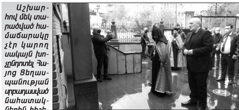
Աշխարհով մեկ տարածված համաճարակը չէր կարող սակայն խոչընդոտել Հայոց Ցեղասպանության սրբադասված նահատակներին հիշելու եւ ոճրագործությունը դատապարտելու արարողությունները:

2020 թվականի ապրիլի 23-ին, ժամը 21:00-ին, վիրահայերը իրենց տներում մոմ վառեցին ու աղոթք բարձրացրին անմեղ զոհերի հոգու խաղաղության համար: Վրաստանի տարբեր շրջանների եւ մայրաքաղաք Թբիլիսիի հայ ազգաբնակչությունը միացավ աշխարհով մեկ ընթացող առցանց քայլարշավին: Ապրիլի 24-ին, ժամը 12:00-ին