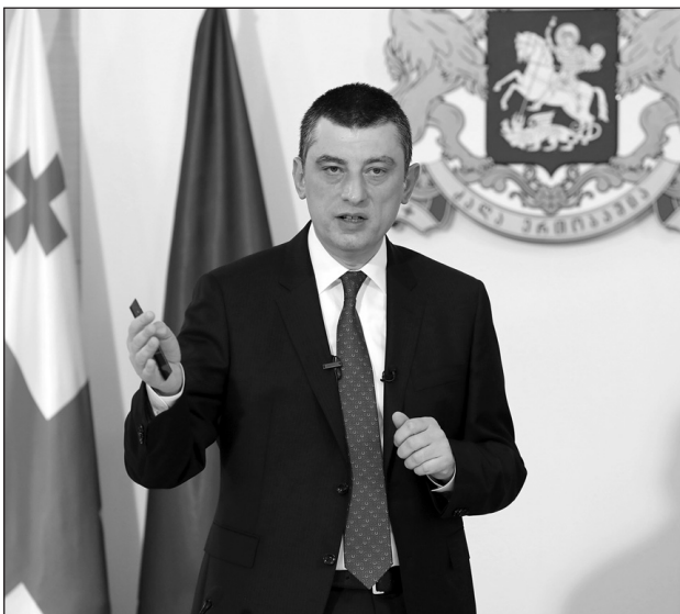
(Հարունակությունը՝ 2-րդ էջում)

Երրորդ փուլում կբացվեն մեծածախ խանութները, բացառությամբ՝ մեծ հանրախանութների,