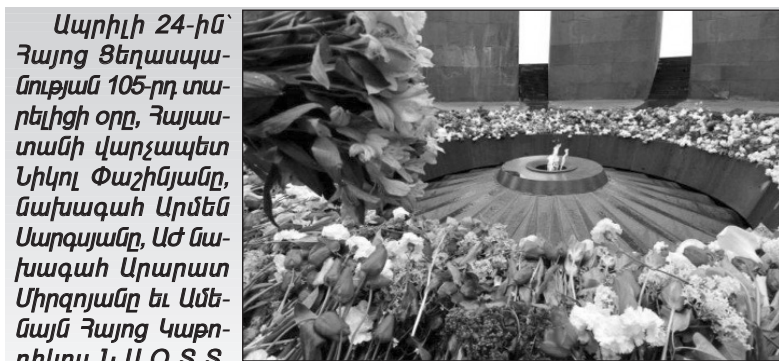
Ապրիլի 24-ին՝ Հայոց Ցեղասպանության 105-րդ տարելիցի օրը, Հայաստանի վարչապետ Նիկոլ Փաշինյանը, նախագահ Արմեն Սարգսյանը, Աժ նախագահ Արարատ Միրզոյանը եւ Ամենայն Հայոց Կաթողիկոս Ն.Ս.Օ.Տ.Տ. Գարեգին Երկրորդը այցելեցին Ծիծեռնակաբերդի հուշահամալիր: Խոնարհումի արարողությունում ուղեկցվեց հանրահայտ դաշնակապար, Հայաստանի վաստակավոր արտիստ Հայկ Մելիքյանի կատարմամբ:

Ցեղասպանության 105-րդ տարելիցի առթիվ հատուկ ուղերձով հանդես եկան Հայաստանի վարչապետ Նիկոլ Փաշինյանն ու նախագահ Արմեն Սարգսյանը: Նրանք երախտիքի խոսքեր ուղղեցին Հայոց Ցեղասպանությունը ճանաչած երկրներին եւ համաշխարհային հանրությանը կրկին կոչ արեցին Մեծ Եղեռնի ճանաչմանը վճռական «Ոչ» ասել ազգային խտրականության, ժխտողականության, պատմության էջերի վերանայման քաղաքականությանը: