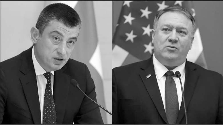
ժընկերության խարտիայի լիազուժար նիստի հարցին: Նիստի հետաձգման պատճառը «Կովիդ-19»-ն էր: Կողմերը հույս հայտնեցին, որ լիազուժար նիստը կկատարվի (Շարունակությունը՝ 2-րդ էջում)

Հուլիսի 27-ին, Վրաստանի վարչապետ Գիորգի Գախարիայի եւ ԱՄՆ պետքարտուղար Մայք Պոմպեոյի միջև, տեղի է ունեցել հեռախոսազրույց, որի ընթացքում կողմերը քննարկել են ռազմավարական գործընկերության հիմնահարցեր: