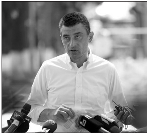
տանի եւ ԱՄՆ-ի միջեւ գործընկերությանը սպառնալիք չստեղծվի,- հայտարարեց վարչապետը:

- Մեր բոլորի, ոչ միայն կուսակցության եւ կառավարության, այլեւ ողջ երկրի համար նշանակալից է, որ Վրաս-