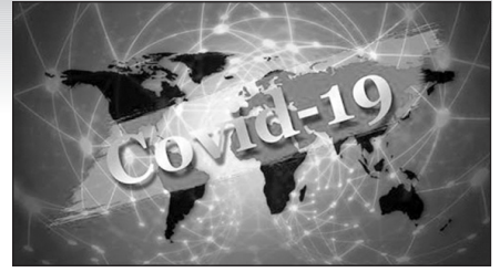
Վրաստանում վարակվել է 1168 մարդ, մահացել է 17-ը, ապաքինվել՝ 940-ը:

Ադրբեջանում վարակվածների թիվը կազմում է 31 560 մարդ: Վարակից մահացել է 441, ապաքինվել՝ 25 168 մարդ: Հունիսի 31-ի տվյալներով՝ Վրաստանում վարակվել է 1168 մարդ, մահացել է 17-ը, ապաքինվել՝ 940-ը: