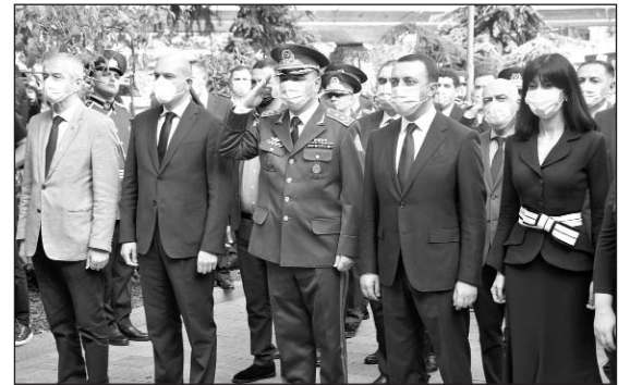
նի բոլոր վարչական շենքերից իջեցվել են պետական դրոշմները:

Սուխումիի անկման 27-րդ տարելիցի կապակցությամբ և Աբխազական պատերազմում զոհվածների հիշատակը հարգելու նպատակով, Վրաստա-