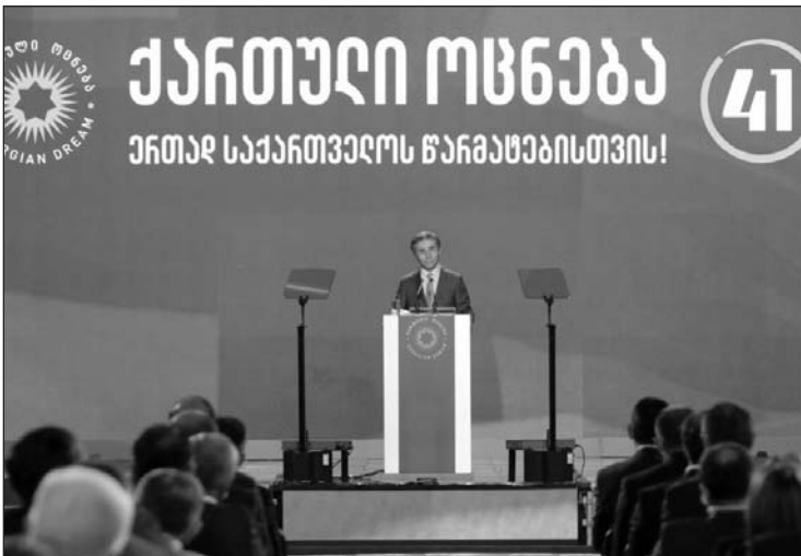
(Շարունակությունը՝ 4-րդ էջում)

Հոկտեմբերի 1-ին «Վրացական երազանք - ժողովրդավարական Վրաստան» կուսակցության գործադիր քարտուղար եւ ընտրական շտաբի ղեկավար, Իրակլի Կոբախիձեն կենտրոնական ընտրական հանձնաժողովին ներկայացրեց 2020 թվականի խորհրդարանական ընտրությունների կուսակցության ցուցակը: Իսկ մինչ այդ Թբիլիսիում, «Էքսպո-Ջորջիա» ցուցահանդեսային կենտրոնում, անցկացվեց խորհրդարանական ընտրություններին կուսակցական ցուցակի ներկայացման շնորհանդեսը: Թեկնածուների ներկայացման արարողությանը մասնակցեցին եւ ելույթ ունեցան «Վրացական երազանք - ժողովրդավարական Վրաստան» կուսակցության նախա-