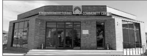
տասնեյակներով: Հիշեցնենք, որ Հասարակական

ի եւ «Liberty Bank»-ի մասնաճյուղերը, որոնք թոշակառուներին հնարավորություն կտան տեղում ստանալ իրենց կենսաթոշակները: