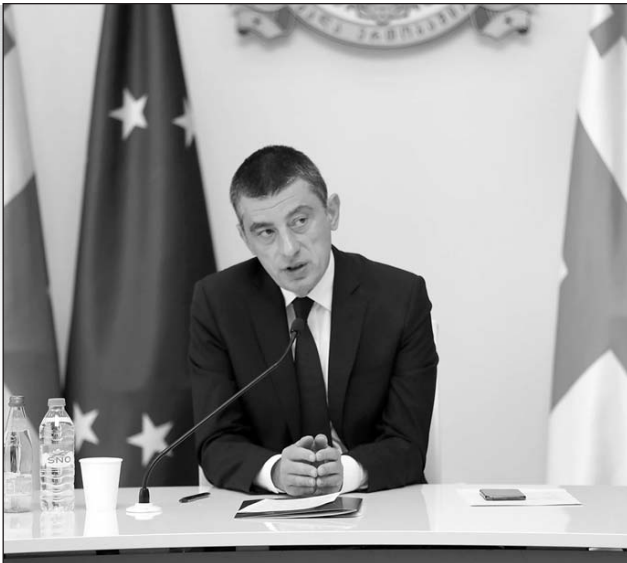
(Շարունակությունը՝ 2-րդ էջում)

Հոկտեմբերի 19-ին, Վրաստանի վարչապետ Գիորգի Գախարիան նախագահությամբ, անցկացվեց միջգերատեսչական համակարգող խորհրդի հերթական նիստը, որի մասնակիցները քննարկեցին կորոնավիրուսի տարածման տագնապալի վիճակագրության պայմաններում իրականացվելիք միջոցառումների հարցը: Հենց սկզբից վարչապետ Գիորգի Գախարիան հայտարարեց, որ տնտեսական սահմանափակումների տեսանկյունից լոգոտուն չի հայտարարվի, քանի որ դրա անհրաժեշտությունը չկա, եւ երկրի էկոնոմիկան դրան ուղղակի չի դիմանա: