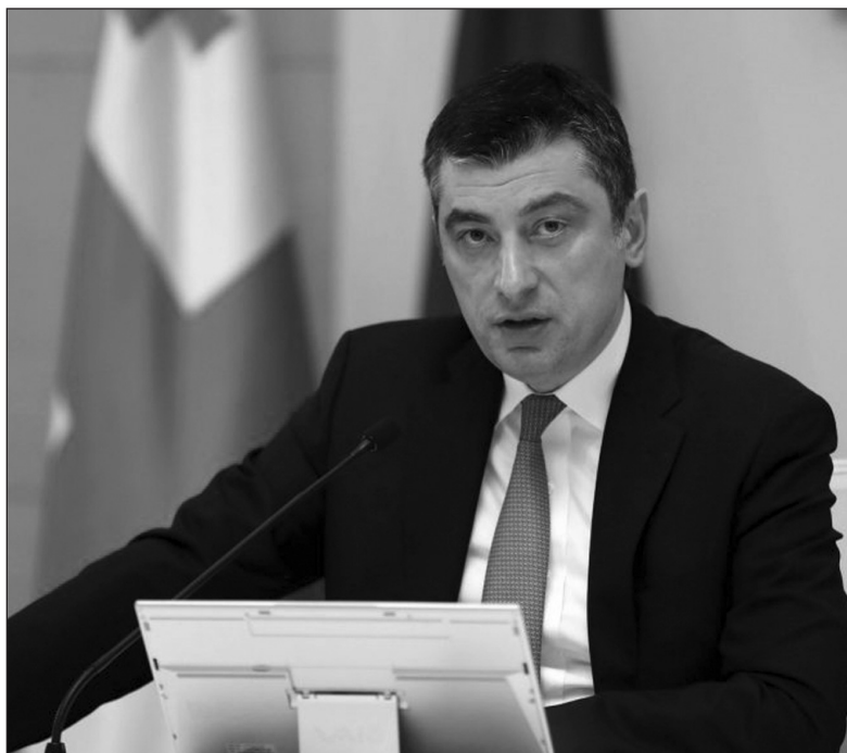
Ակնհայտ դարձավ հոկտեմբերի 31-ին, երբ Վրաստանի քաղաքացին քաղաքական 9 կուսակցությունների համար քվեարկեցին (Շարունակությունը՝ 4-րդ էջում)

- Այսօր անենակարելորդն ու առաջնայինը ոչ թե քաղաքական գործընթացի գնահատումն է, այլ այս քաղաքական իրավիճակից արագ ելք գտնելու քաղաքացիների ու բնակչության պահանջը: Վստահ եմ, քաղաքական ոլորտը լիովին գիտակցում է դա: Քաջ գիտակցում եմ նաեւ, որ այսօր տեղի ունեցող որոշ ապակառուցողական քայլեր եւ գործողություններ չեն ունենա քաղաքացիների աջակցությունը: Դա