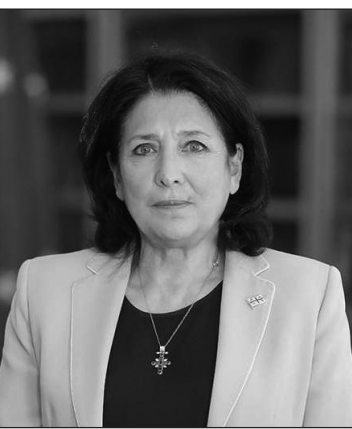
(Թեմայի շարունակությունը՝ 2-րդ էջում)

«Կովկասում նոր դարաշրջան է սկսվում, շնորհավորում եմ մեր բարեկամներ հայերին ու ադրբեջանցիներին ողբերգական պատերազմի ավարտի կապակցությամբ: Շնորհակալություն եմ հատնում ֆասիլիտատորներին: Ցավակցում եմ գոհվածների ընտանիքներին: Խաղաղությունն ու կայունությունն այլընտրանք չունեն: Միասին համագործակցության նոր փուլ ենք մտնում», - գրում է Վրաստանի նախագահը: