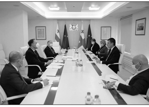
(Շարունակությունը՝ 5-րդ էջում)

նաժամկետ տնտեսական չափանիշների, ինչպես նաեւ հետագա տարիների ընթացքում կառավարության տնտեսական ծրագրի, այդ թվում՝ հաջորդ տարվա պետական բյուջեի ցուցանիշի մասին: Բիզնեսի եւ ֆինանսական հատվածի ներկայացուցիչները նշեցին տնտեսական մարտահրավերները, որոնք նրանք կարելու էր համարում միջնաժամկետ